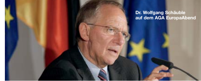
Dr. Wolfgang Schäuble auf dem AGA EuropaAbend